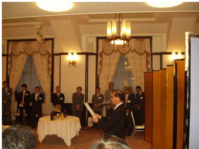
写真：原島先生ごあいさつ

来年は今回のように生物工学会総会とのバッティングを避け、平成21年5月22日（金）に田町駅前の「キャンパスイノベーションセンター東京」で開催することになっております。場所も便利になりますし、会場費も安くなりますので参加していただき易くなると思います。今年以上にたくさんの同窓の皆さんにお目にかかれることを楽しみにしております。